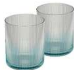
VERRES À COCKTAIL X2 / 310 ML