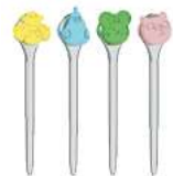
PIQUES APÉRITIF X4 / 8,2 X 1,6 CM