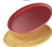
SET PLAQUE DE CUISSON ET SERVICE