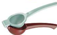
PRESSE-AGRUMES / 22,1 X 7,5 X 5 CM