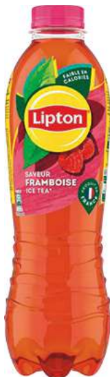
BOISSON AU THÉ GLACÉ SAVEUR FRAMBOISE "LIPTON" 1,25 L. Existe aussi : Citron-citron vert ou thé vert pêche blanche.