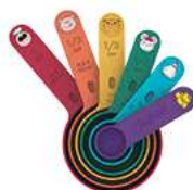
TASSES À MESURER