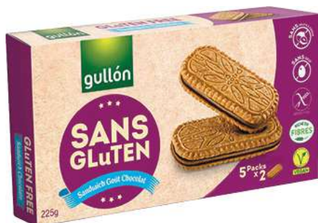
BISCUITS SANS GLUTEN “GULLON” Sandwich goût chocolat 225 g. Valable aussi sur la variété Biscuits aux pépites de chocolat 220 g.