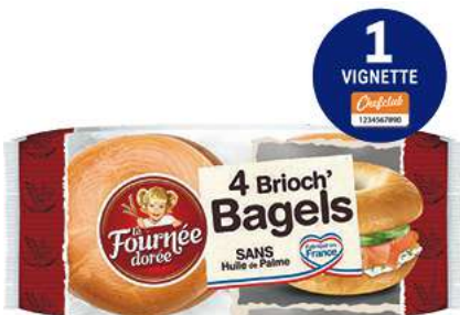
BRIOCH' BAGELS “LA FOURNÉE DORÉE” Classique ou 2 sésames 300 g.