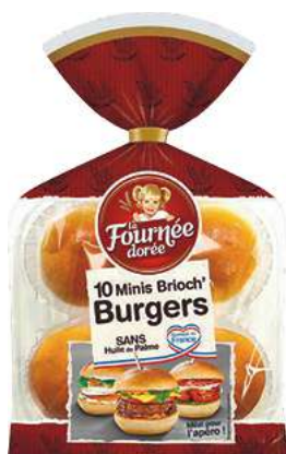
MINIS BRIOCH' BURGERS “LA FOURNÉE DORÉE” Classique ou Sésame 200 g.