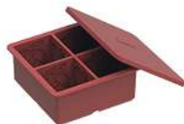
BAC À GLAÇONS / 11 X 11 X 5 CM