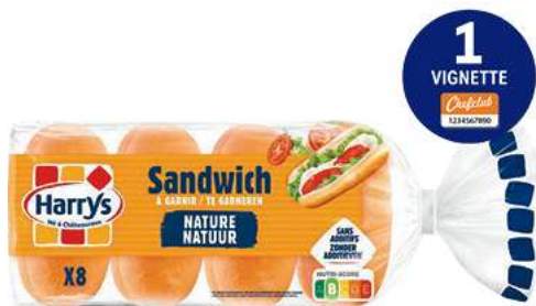
SANDWICH À GARNIR “HARRYS” Nature ou Au beurre 360 g.