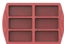
MOULE À MINI-CAKES / 27 X 17,8 X 4,3 CM